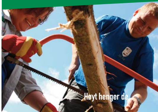
Høyt henger de