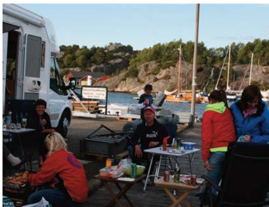
Bobiltreff i bryggkanten.