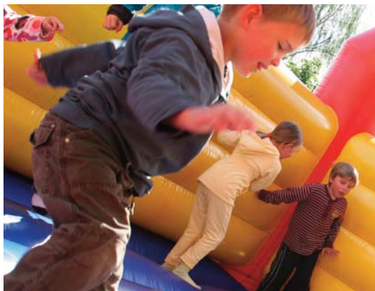
Hoppeborgen er alltid populær.